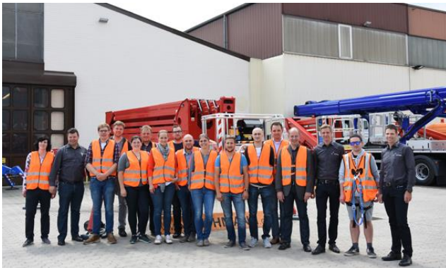
Bild 1: bbi-Juniorentagung 2018: Intensiver Austausch und spannende Firmenbesuche.